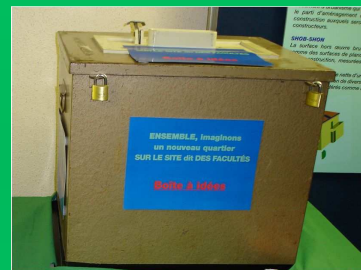
Cette urne « boîte à idées » renferme le projet d'aménagement des 6 hectares : venez donner votre avis !